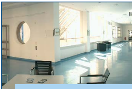
Galerie im ersten Stock der Klinik