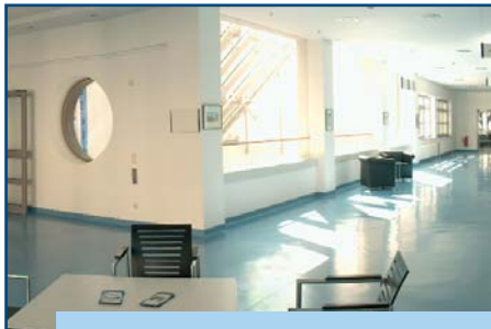
Galerie im ersten Stock der Klinik

Presse- und Öffentlichkeitsarbeit Michael Bührke Klosterstraße 75 48143 Münster ☎ (0251) 5007 - 2217 ☎ (0251) 5007 - 2249 presse@raphaelsklinik.de