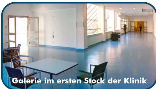
Galerie im ersten Stock der Klinik