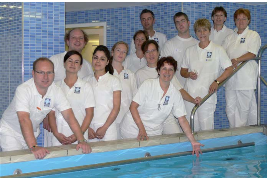
Das Team der Physiotherapie

Unsere Abteilung besteht aus einem Team von zehn Physiotherapeutinnen und Physiotherapeuten sowie drei Masseuren und medizinischen Bademeistern.